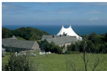
35x24 = 830m 2 avec 2 mâts