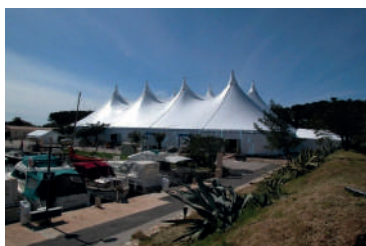
35x60 = 2090 m / 8 mâts