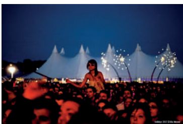
35x72 = 2 510 m 2 / 10 mâts