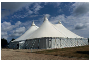
35x36 = 1 250m 2 avec 4 mâts