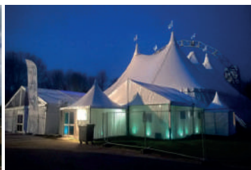
35x48 = 1 670m 2 / 6 mâts