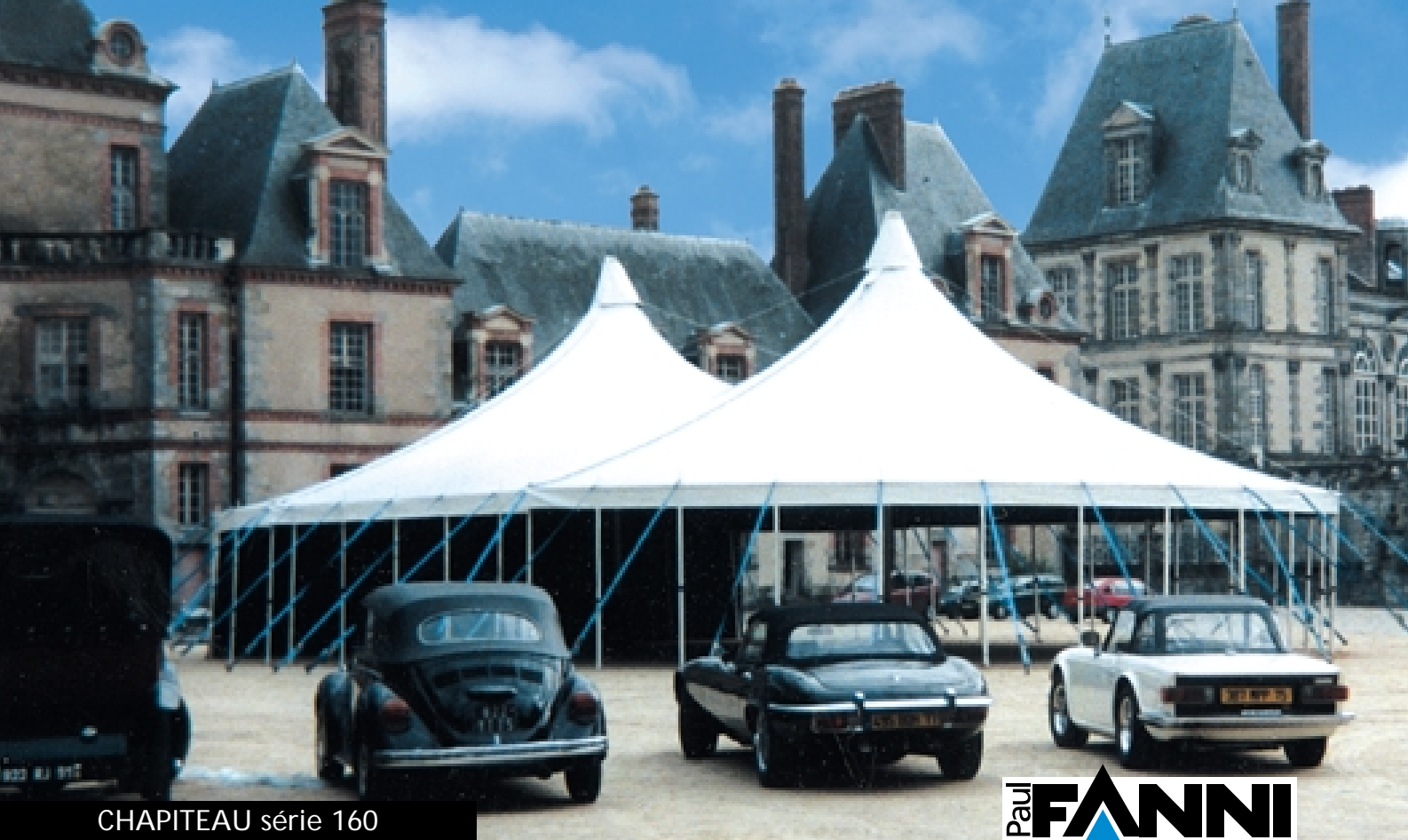
CHAPITEAU série 160